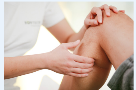
Bei der Bowen Technik können Gelenke in ihre natürliche Position zurückgelangen.