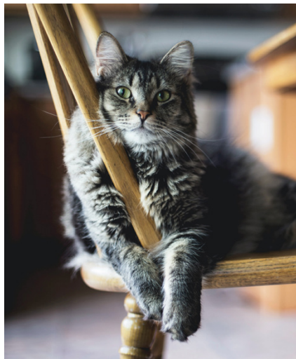
In Zusammenarbeit mit der Calingo Insurance AG bietet die EGK neu eine Unfall- und Krankenversicherung für Hunde und Katzen an.