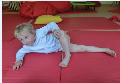
Die Entwicklungs- und Lerntherapie nach PÄPKi® richtet sich an Kinder mit funktionellen Entwicklungseinschränkungen oder -verzögerungen.

Die Entwicklungs- und Lerntherapie nach PÄPKi® ist eine sowohl pädagogisch als auch medizinisch orientierte Fördermethode für Kinder mit funktionellen Entwick-