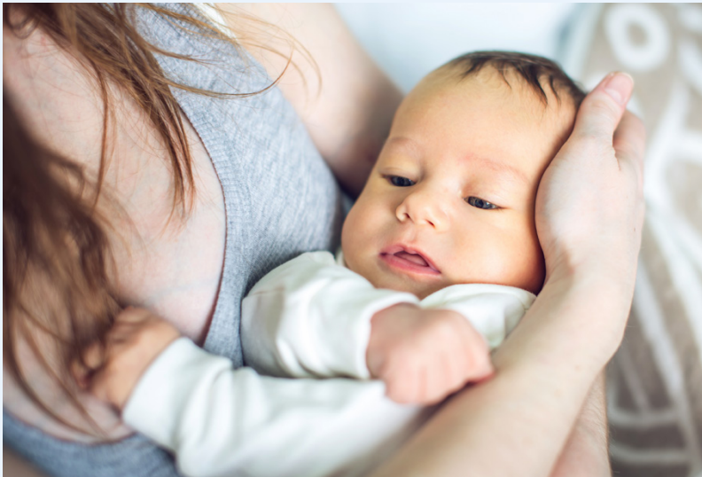
Die EEH fördert die Bindung zwischen Eltern und Kind, wenn sie Belastendes erlebt haben.